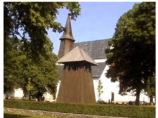
Roma kyrka på Gotland med klockstapeln i förgrunden

Föreningen har sina styrelsemöten i Svenskbygården. I svenskbygården finns f.ö. ett museum .